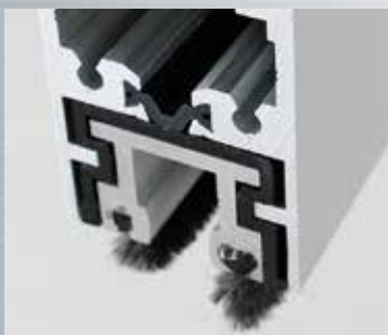
Sezione del profilo con spazzole a pavimento