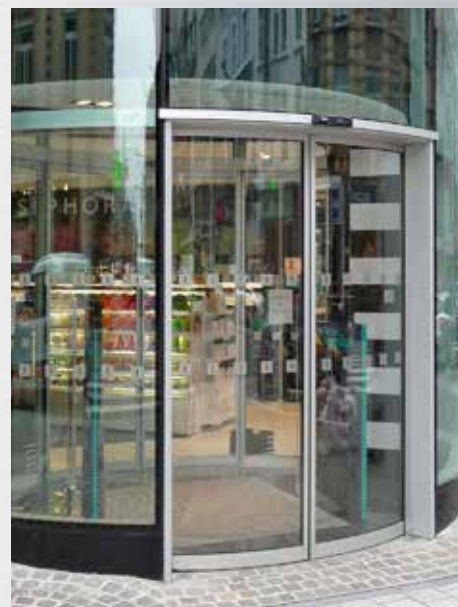
Elegante profilo del telaio leggero anche in versione curvata